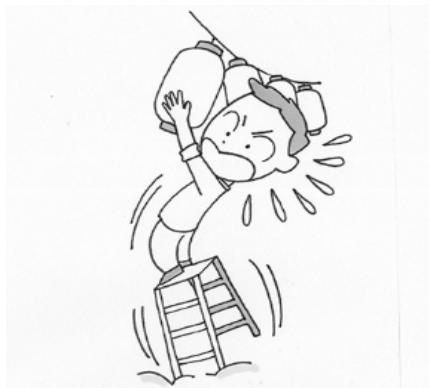
脚立がぐらつきバランスを崩した。