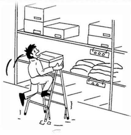
脚立がぐらつきバランスを崩した。