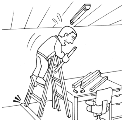
脚立がぐらつきバランスを崩して飛びおりた。